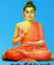
గురు గోరమ బుద్ధ