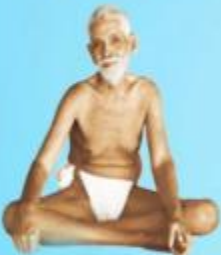
గురు రమణ మహర్షి