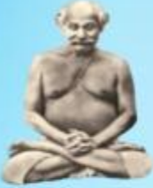
గురు లాహిరి మహాశయి