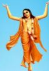
గురు చైతన్య మహా ప్రభువు