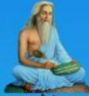
గురు వాల్మీకి మహర్షి