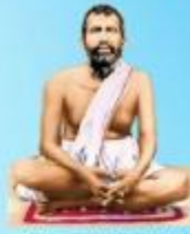
గురు రామకృష్ణ పరమహంస, అమ్మ శారదాదేవి