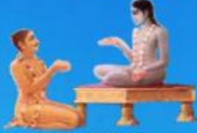
గురు శుక మహర్షి