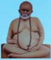
గురు వైలింగ్ స్వామి