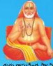
గురు రాఘవేంద్ర స్వామి