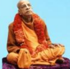
గురు భక్తవేదాంత ప్రభుపాద