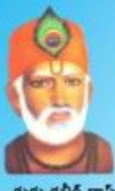
గురు కబీర్ దాస్