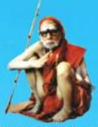
గురు చంద్రకీర్తిర పరమాచార్య