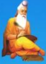
గురు వేదవ్యాస మహర్షి