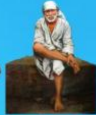
గురు హాయి బాలా