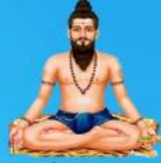
గురు వీరబ్రహ్మేంద్ర స్వామి