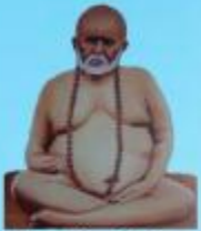
గురు వైలింగ్ స్వామి