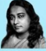
గురు భక్తవేదాంత ప్రభుపాద