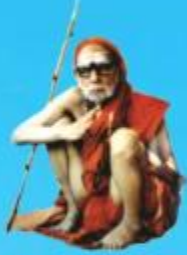
గురు చంద్రశేఖర పరమాచార్య