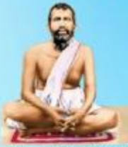
గురు రామకృష్ణ పరమహంస, అమ్మ శారదాదేవి