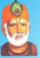
గురు కబీర్ దాస్