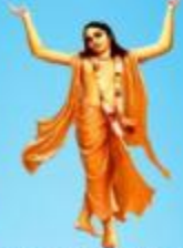
గురు చైతన్య మహా ప్రభువు