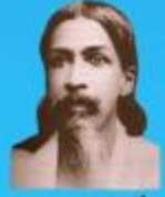
గురు రమణ మహర్షి