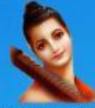
గురు వారద మహర్షి