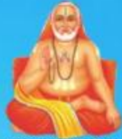
గురు రాఘవేంద్ర స్వామి